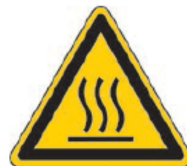
Hoiatus: Kuum pind